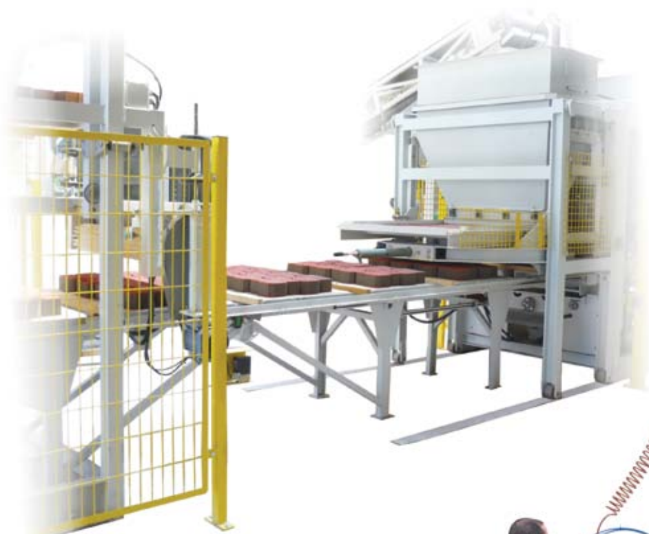
Detalle de pinza neumática para paletizado manual.

La PRIMA - L es la misma prensa PRIMA pero con una mayor automatización, añadiendo un conjunto ascensor-descensor que facilita el proceso de traslado de las bandejas para el curado de los productos y una pinza manual o paletizador automático para la paletización final de las piezas.